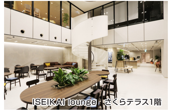
ISEIKAI lounge さくらテラス1階