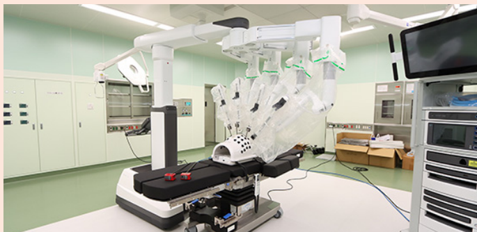
内視鏡手術支援ロボット「ダビンチ」

医誠会国際総合病院では、AI(人工知能)が医療をアシストする「AI ホスピタル」体制を整備し、高度で先進的かつ最適化された医療サービスの提供を目指します。本講座では、看護部、薬剤部、臨床工学部で行っている取り組みをご紹介します。